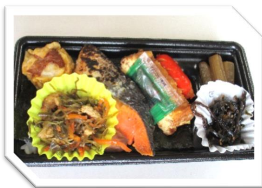
特上のり弁当 595円 (税込)