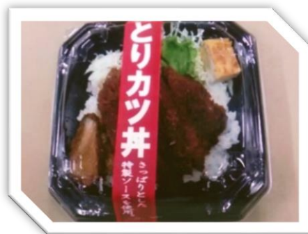
とりカツ丼 595円 (税込)