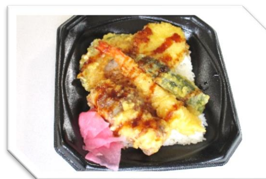
天丼 595円 (税込)