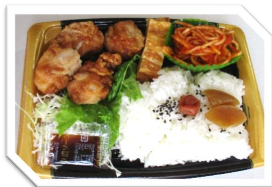
若鶏の竜田揚げ弁当 595円 (税込)

ご注文は1週間前までに3個以上からお願いします。数量の変更は2日前まで受け付けます。直前のキャンセルについては料金をいただく場合がございますので予めご了承ください。10個以内のご注文は原則1団体様1種類でお願いします。