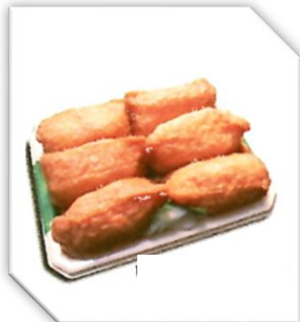
いなり寿司 6個 390円 (税込)