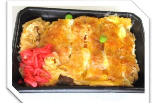
煮込みカツ丼 595円 (税込)