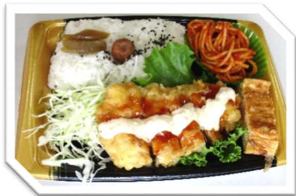
チキン南蛮弁当 595円 (税込)