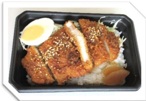
ソースかつ丼 540円 (税込)