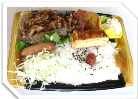
豚生姜焼き弁当 595円 (税込)