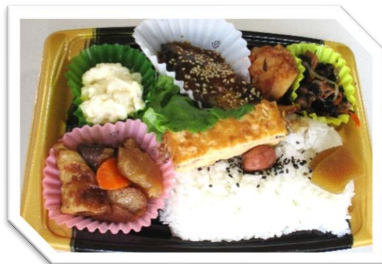
さばの味噌煮弁当 595円 (税込)