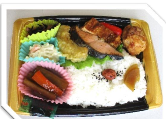
まごころ弁当 630円 (税込)