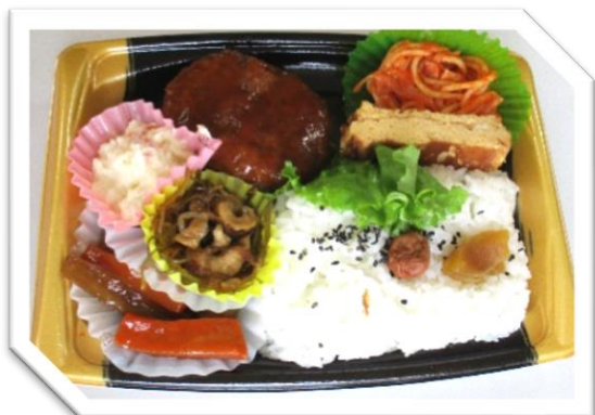
ハンバーグ弁当 595円 (税込)